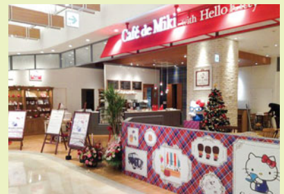
ダイバーシティ店