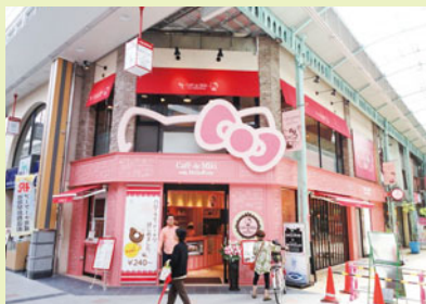
Café de Miki with Hello Kitty